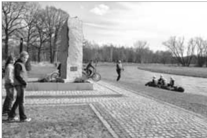
Větší průtok na Nise využili hasiči k výcviku plavby na člunu. Zároveň kontrolovali naplavení případných překážek v řečišti.

Do příštího čísla HRÁDECKA chystáme příspěvek o krizovém štábu města.