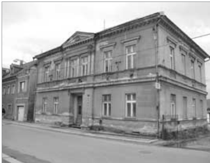
Dům č. p. 99, Žitavská ulice

Co se týká hrádeckých evergreenů, tři prázdných domů – „ruské“ vily, domu proti Azylu na rohu Sokolské ulice a domu č. p. 99 na Žitavské ulici – tak ty se také podařilo vydražit. Každý z těch tří objektů má jiného vlastníka a všichni potvrdili svou připravenost zahájit rekonstrukce vydražených objektů ještě v letošním roce. V případě všech tří objektů se jedná o kombinaci využití na byty a nebytové prostory v přízemí objektů. Pro zajímavost, tyto tři objekty se vydražily dohromady zhruba za 2,2 milionu korun, což je necelá čtvrtina částky, za kterou v minulosti město prodalo všechny byty a tyto objekty Stavební hrádecké společnosti. Je na zvážení členů HRÁDECKA, aby posoudili, nakolik město udělalo v minulosti výhodný obchod se Stavební hrádeckou společností.