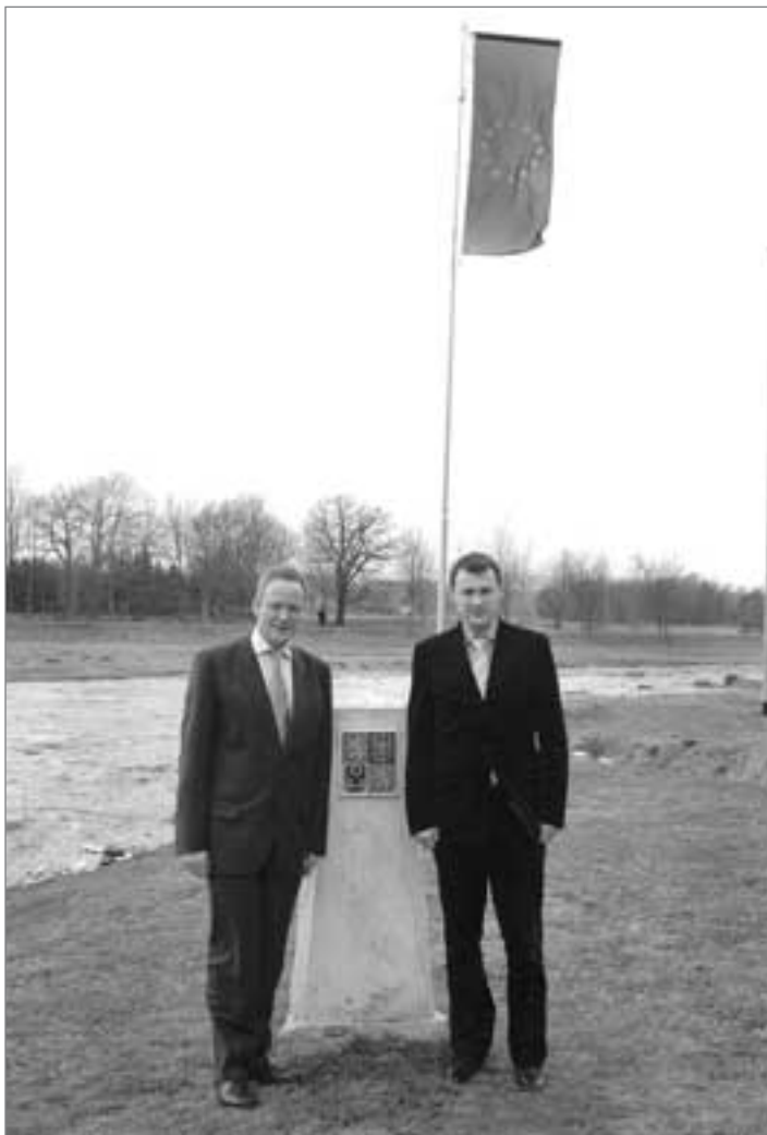
27. března navštívil Hrádek nad Nisou ministr zahraničí Cyril Svoboda. Ještě předtím, než se spolu se starostou Martinem Pútou a místostarostkou ThMgr. Hedvikou Zimmermannovou vydali na Trojzemí, debatovali o problému, který ve vztahu k zahraničí pálí město nejvíce: výstavba propojení silnice R 35 a B 178 a osud před dvěma lety podepsané mezinárodní smlouvy.