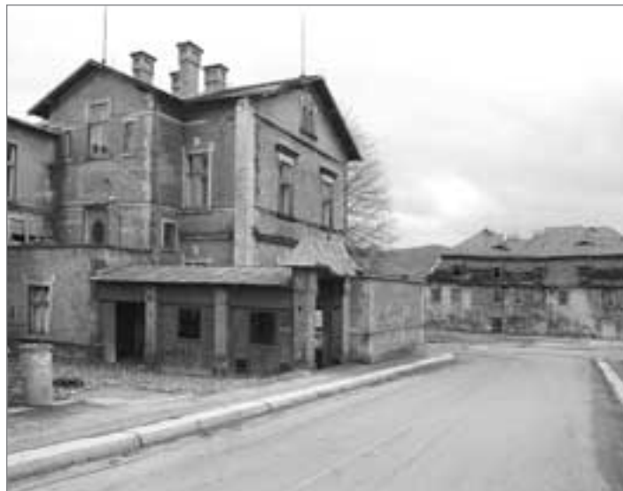
Dům č. p. 356, Sokolská ulice

Náhon je strategický pozemek, který je sice široký jen od tří do pěti metrů, ale prochází přes celé město a ovlivňuje celou řadu nemovitostí a stavebních záměrů. Město tím v podstatě získává na jedné straně možnost ovlivňovat všechny tyto záměry na poměrně významné části území v Hrádku a na druhé straně vlastníkům okolních nemovitostí ulehčí situaci, protože bude jasné, na koho se mohou obrátit a s kým mohou řešit případné problémy s tímto pozemkem. Nevěřím, že existuje prostor pro obnovení náhonu v jeho původní funkci, nicméně město nebude tento pozemek prodávat a ve střednědobém horizontu si jej ponechá jako strategický majetek.