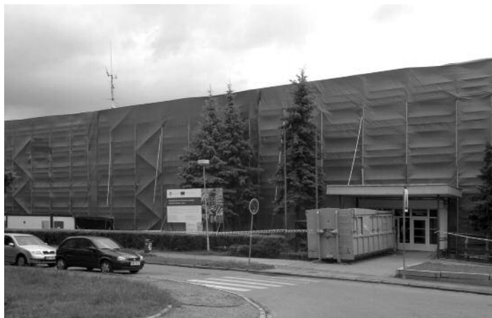
Ilustrační foto ze sanace azbestu školy v Olomouci

Přístavba ZŠ T. G. Masaryka, ve které se dnes nacházejí učebny 1. stupně, dílny, družina a školní jídelna s kuchyní, byla dokončena v roce 1982. Více než 10 let trvala snaha o její rekonstrukci. Nyní k ní dojde s využitím prostředků Operačního programu Životní prostředí.