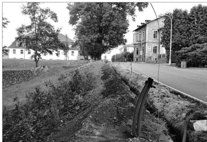
Pokračování na straně 3

Další stavbou, která probíhá v režii Libereckého kraje, je oprava opěrné zdi zpevňující koryto Václavického potoka pod jednou ze zatáček hlavní silnice ve Václavících. Tok potoka byl přesměrován do provizorního potrubí, aby dělníci mohli ze železobetonu a kamene vystavět novou zeď. Doprava v tomto úseku byla řízena semaforem. Liberecký kraj pro tuto opravu využil program financování oprav silnic II. a III. třídy z rozpočtu Státního fondu dopravní infrastruktury.